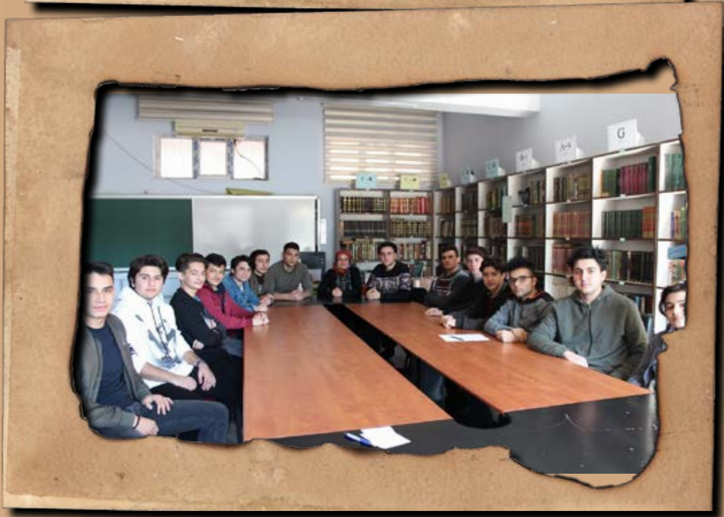
bilgide öncü, ahlakta öncü...