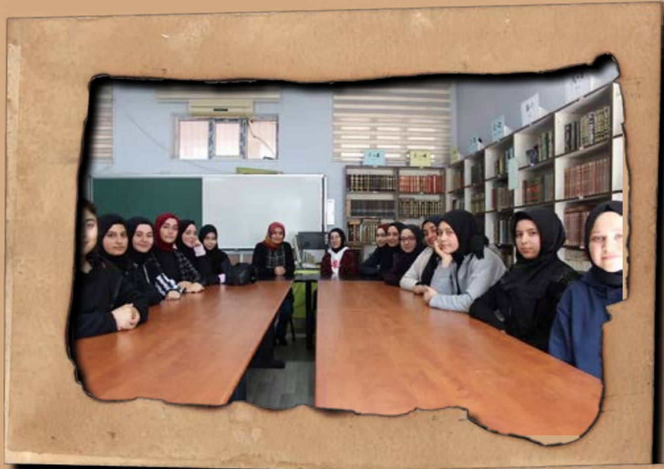
bilgide öncü, ahlakta öncü...