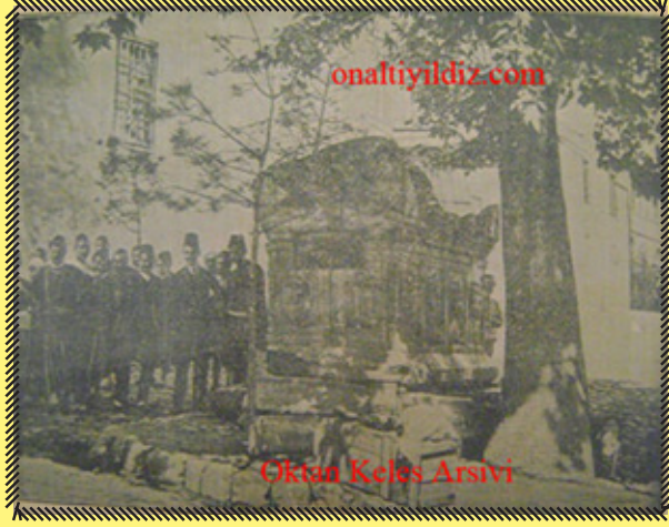
dönemin gazetelerinde yayınlanan görsel