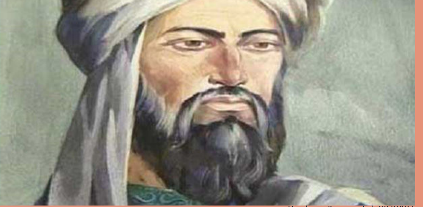
Hazırlayan : Ramazan Arda YILDIRIM

Hârezmî 780 yılında Harezm bölgesinin Hive şehrinde dünyaya gelmiştir. 850 yılında Bağdat'ta ölmüştür. Harezmi sıfır rakamını (0) ve x bilinmeyenini kullandığı bilinen ilk kişidir. Hint rakamları üzerine yaptığı çalışmaların Latince çevirileri ondalık konumsal sayı sistemini 12. yüzyılda Batı dünyasına tanıtmıştır.