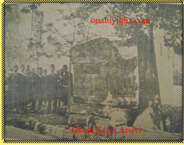
dönemin gazetelerinde yayınlanan görsel